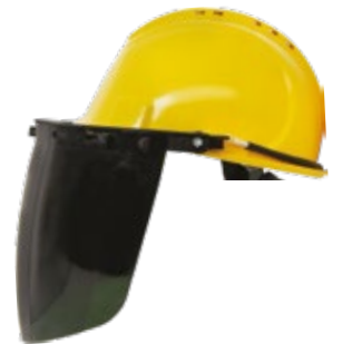
YS-53 + YS-55-G