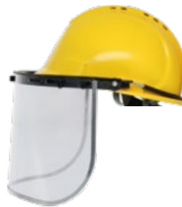
YS-53 + YS-54-C