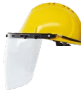
YS-53 + YS-55-C